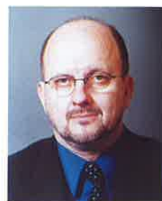
Zmago Jelinčič Plemeniti, podpredsednik - SNS