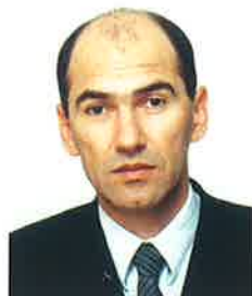
Janez Janša - SDS