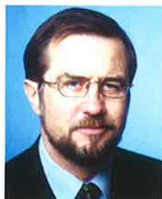
Alojz Peterle - NSi

LDS Liberalna demokracija Slovenije, SDS Socialdemokratska stranka Slovenije, ZLSD Združena lista socialnih demokratov, NSi Nova Slovenija, DeSUS Demokratska stranka upokojencev Slovenije, SNS Slovenska nacionalna stranka, SMS Stranka mladih Slovenije