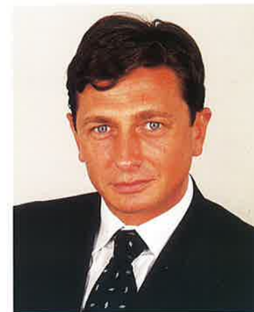
Borut Pahor, predsednik Državnega zbora Republike Slovenije