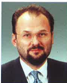
Jelko Kacin, predsednik - LDS