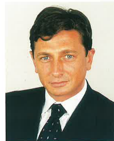
Borut Pahor, predsednik Državnega zbora Republike Slovenije