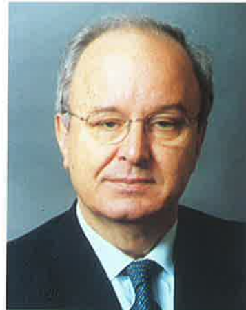
Dr. Andrej Bajuk, predsednik - NSi