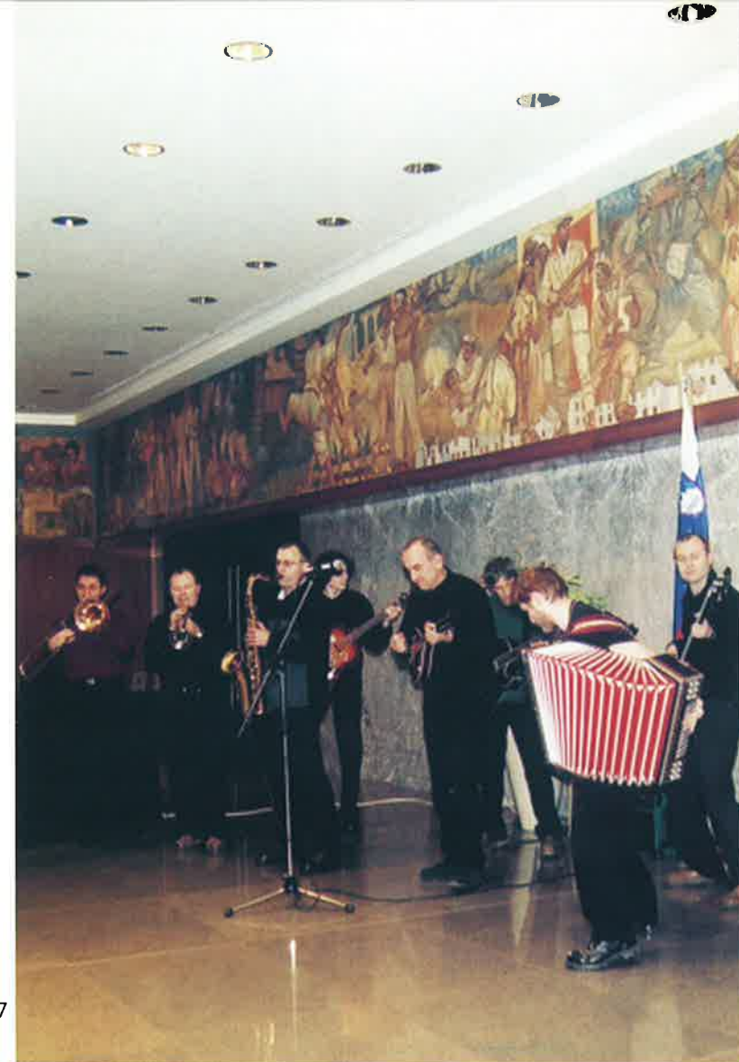
Glasbena skupina Orlek