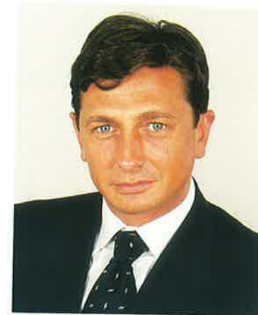
Borut Pahor, predsednik Državnega zbora Republike Slovenije