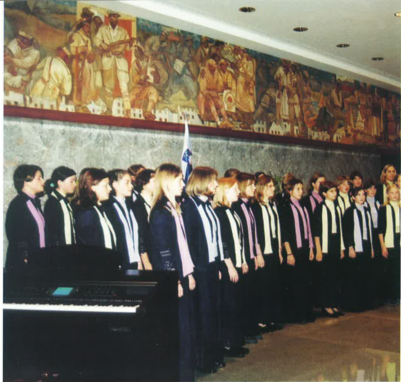
Dekliški pevski zbor Vesna iz Zasavja

V okviru odbora deluje tudi Delovna skupina za področje jezikovnega načrtovanja in jezikovne politike. Sestavljajo jo priznani slovenisti in strokovnjaki drugih strok. Obravnava zlasti jezikovna vprašanja, ki se pojavljajo ob zakonodajnem delu, in druga vprašanja, povezana z rabo in položajem slovenščine kot uradnega in državnega jezika. Svoje predloge, stališča in sklepe lahko uveljavlja prek odločitev odbora in državnega zbora oziroma z njimi seznanja ustrezne organe in širšo javnost.