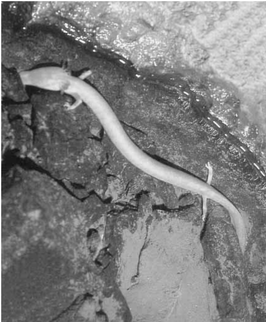
Človeška ribica ( Proteus anguinus )