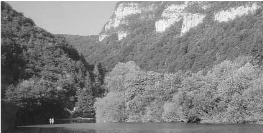
Kanjon reke Kolpe