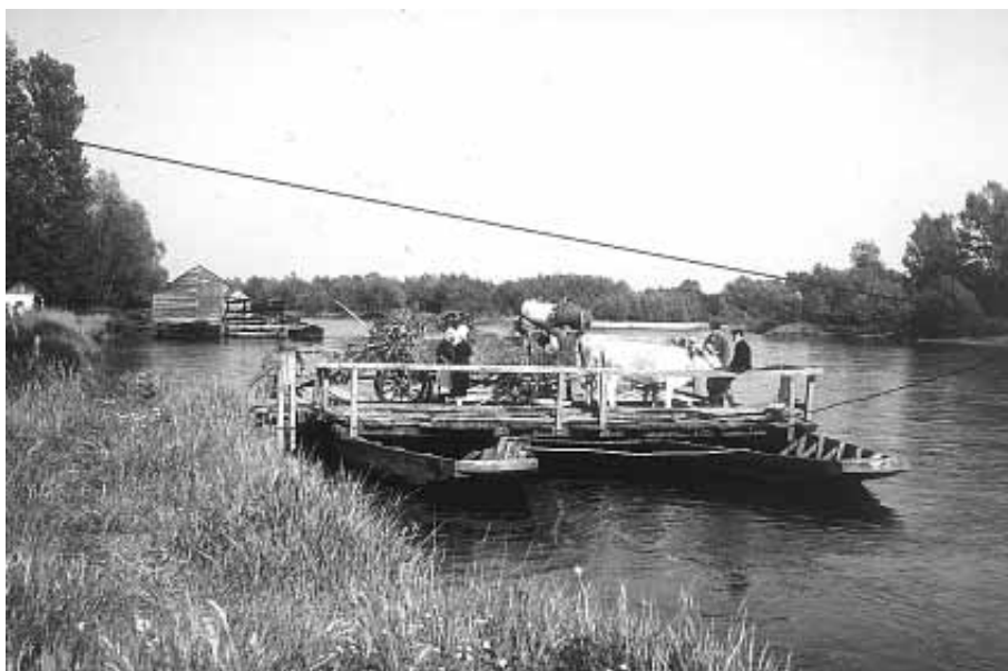
Brod na reki Muri. V ozadju še mlin na levem bregu pri Bisticah 1957

Družba je opredeljena, kot najobsežnejši socialni sistem, ki ureja vse komunikacije in se avtopoetično predstavlja tako, da v rekurzivni mreži informacij proizvaja vedno nove komunikacije. Nastane avtopoetičen sistem, ki se sestoji zgolj iz komunikacij. Komunikacija lahko proizvaja le komunikacije. Oblikuje se sistem, kjer je okolje najpomembnejši pogoj za oblikovanje sistema. Luhmann v konceptu splošne teorije družbe ponudi pojem "funkcionalne diferenciacije". Družba