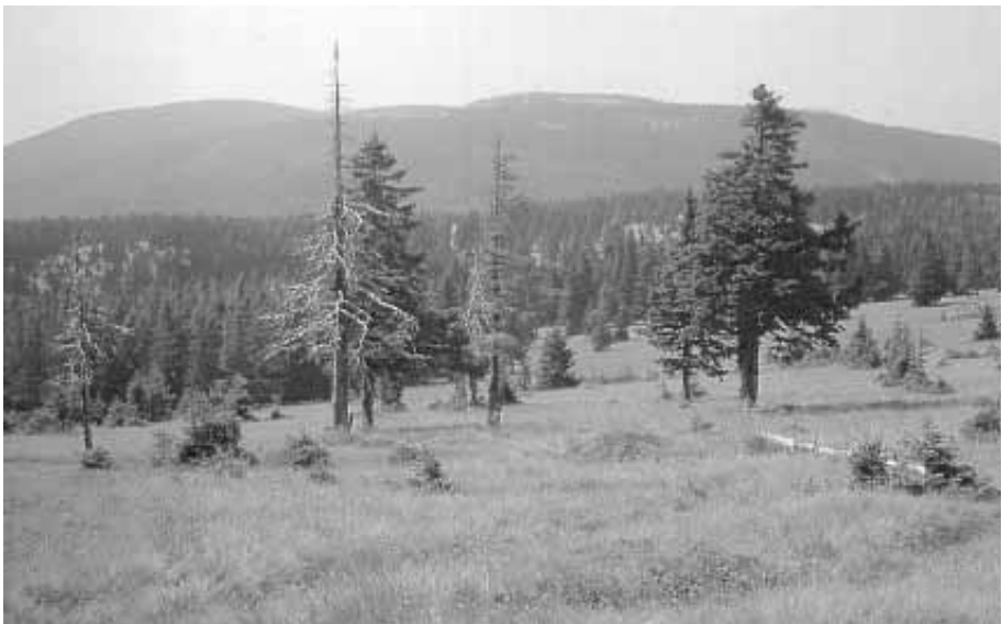
Tipična pohorska pokrajina

Reševanje vprašanj varovanja okolja, torej posebne teme GLOBE, po njegovem vedno pokaže pot k bolj demokratičnim političnim rešitvam. In čeprav se mandat parlamentu izteka, je smisel tega pogovora v tem, da se začrtajo oblike sodelovanja med parlamentarci in nevladnimi organizacijami in državljanji. S tem je namreč povezana tudi učinkovitost parlamenta.