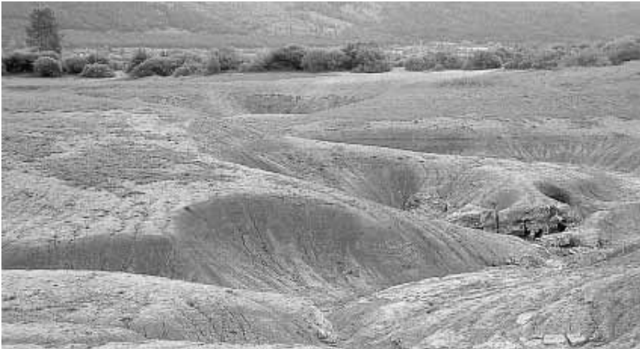
Požiralniki na Cerkniskem jezeru

je nenehno prihajal v stik z odbori in komisijami, vodstvom parlamenta in njegovimi tehničnimi službami. Velika večina teh je naklonjeno obravnavala delo GLOBE Slovenija, ne pa vsi. Zato ima parlament pomembno nalogo, da uredi status poslanskih organizacij, kakršna je GLOBE, in omogoči njihovo optimalno delovanje. V nasprotnem primeru so takšne organizacije odvisne od posameznih ljudi, njihovih interesov ali celo interesov gospodarskih družb oziroma lobijev, to pa je v nasprotju s smislom in ciljem njihovega delovanja. Samo velika naklonjenost vodstva parlamenta je omogočila njegovo relativno uspešnost, zato se vodstvu v imenu GLOBE še posebej zahvaljujem.