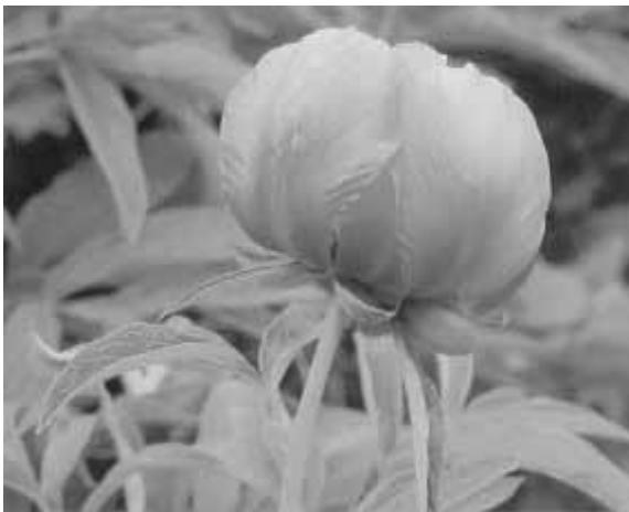
Potonika (Paeonia officinalis)