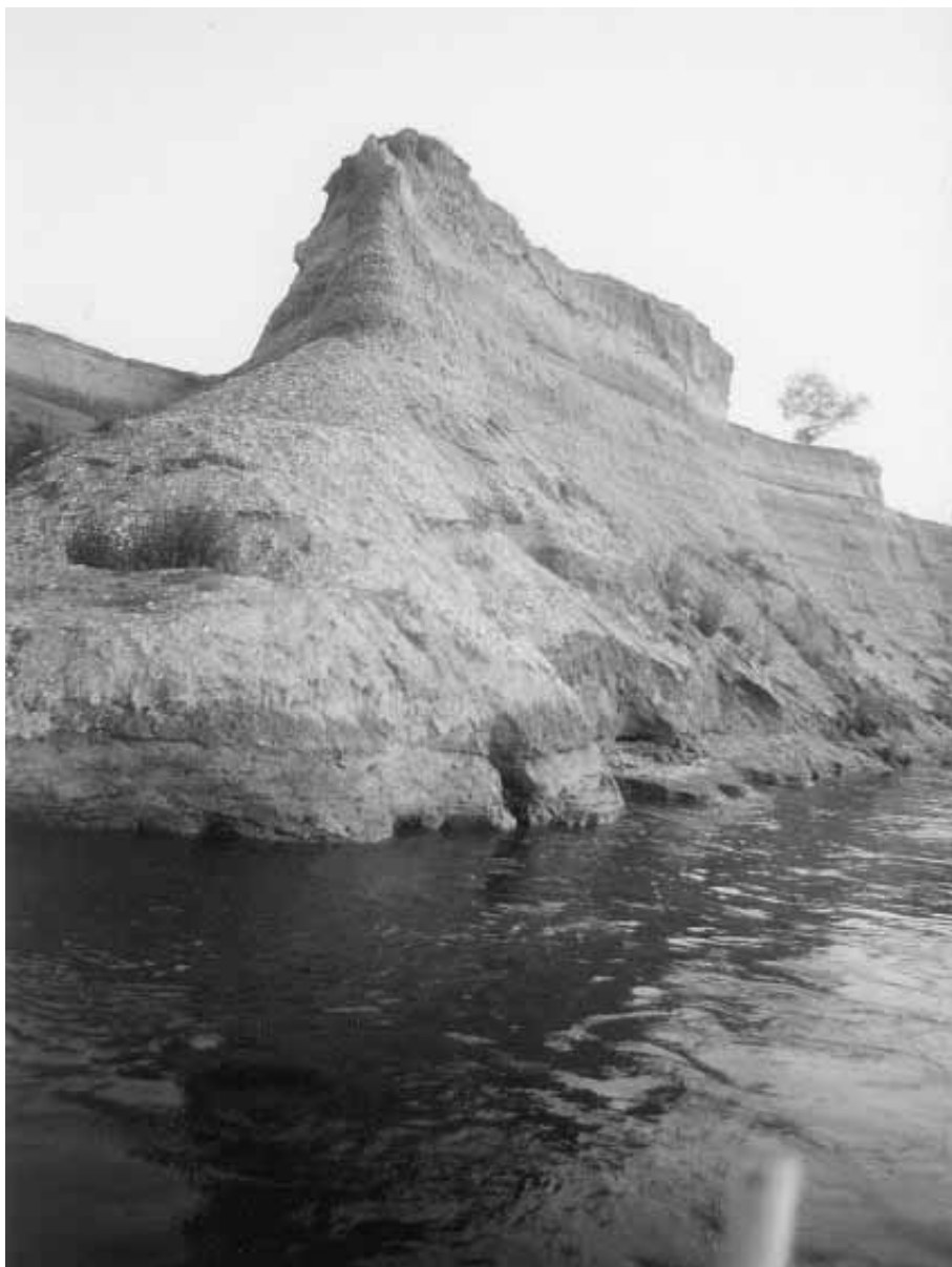
Po sotočju Mure v Dravo z desnim bregom pri nizkem stanju vode

se diferencira na podsisteme, katerih načela samoselektivnega oblikovanja sistema so: dednost, naselitev ali kombinacija obojega. To pomeni, da vsak funkcionalni sistem in podsistem vključujeta neenakost in enakost in pri tem ne zanemarjata hierarhije ter njenega vrha. Žal živimo v družbi, ki ne more poudarjati svoje enotnosti v sebi in tudi svoje neenotnosti ne; pa še povsem brez vrha je (Luhmann 1991).