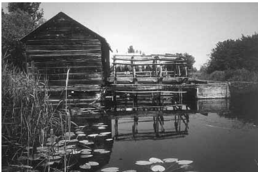
Rokav Mure (mrtvica) z mlinom na Muri "Bobri"

Vsa navedena dejstva govorijo v prid in potrebi po regionalnem parku Mura, saj širše območje reke Mure predstavlja naravno in zaokroženo območje prvobitne neokrnjene narave z obilico naravnih znamenitosti, ravno tako pa predstavlja tudi enovito zaokroženo območje, ki po svojem obsegu leži na teritoriju številnih občin. V nasprotnem primeru obstaja resna nevarnost, da bi območje, ki predstavlja neprecenljivo naravno dragocenost bilo izbuljeno za vedno.