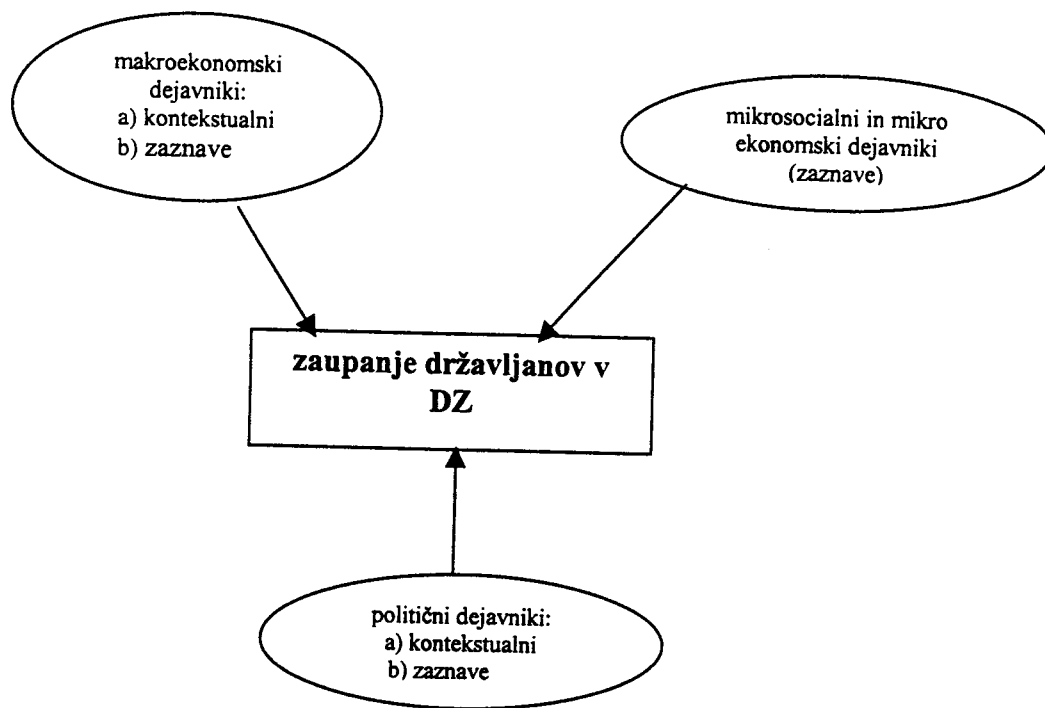
Slika 1: Raziskovalni model - zvrsti dejavnikov, ki vplivajo na stopnjo zaupanja državljanov v DZ